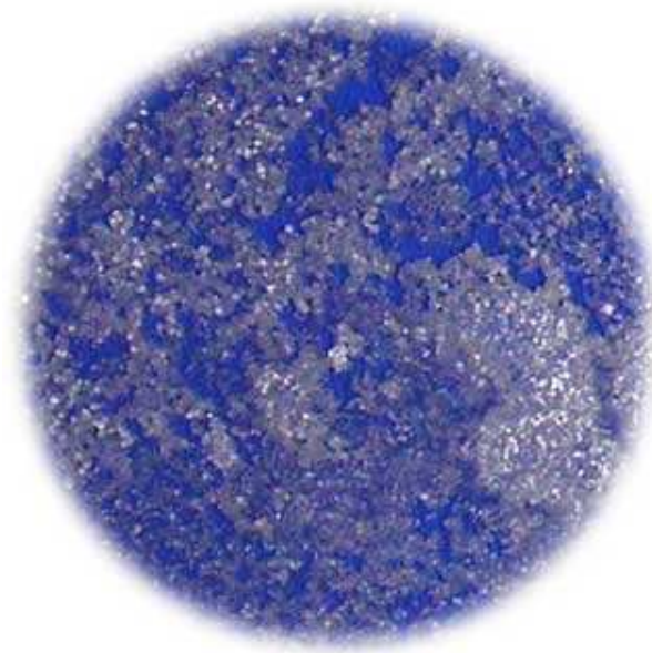
Salzkristalle ohne Vita Tronic©